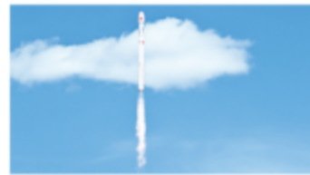
朱侓二号改进型遥六运载火箭发射成功