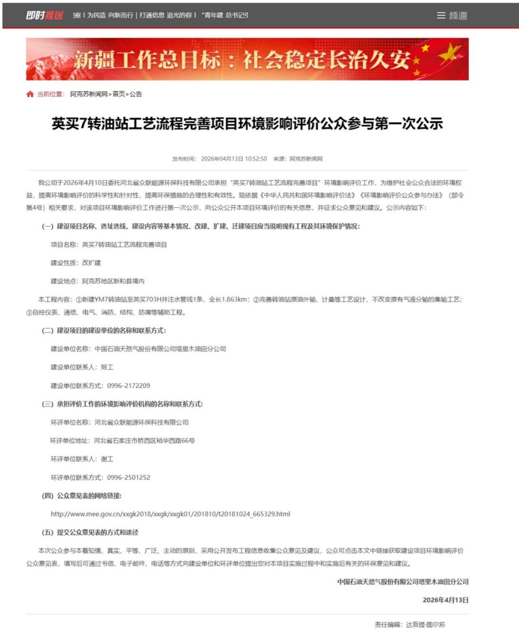
图 2-1 第一次信息公示情况