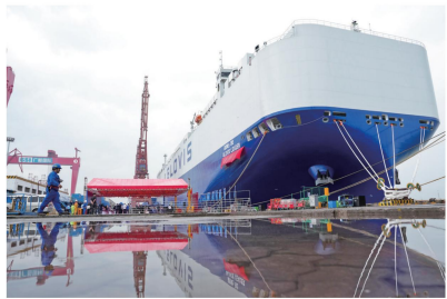
4月28日，中船集团国际船舶中船贸易为韩国HMM轮建造的全球最大汽车运输船“格罗唯里”号在大连交付。

工业和信息化部今年2月发布的数据显示，2025年造船完工量、新接订单量、手持订单量等我国造船三大指标国际市场份额连续16年保持全球领先。除了“量大”，更抢眼的是“质优”。近年来，我国高技术、高附加值船舶建造交付数量大幅增加，在部分技术领域更是打破了国外垄断。